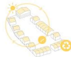
4. Energieneutrale woningen en duurzame materialen