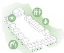
2. De park is jouw tuin