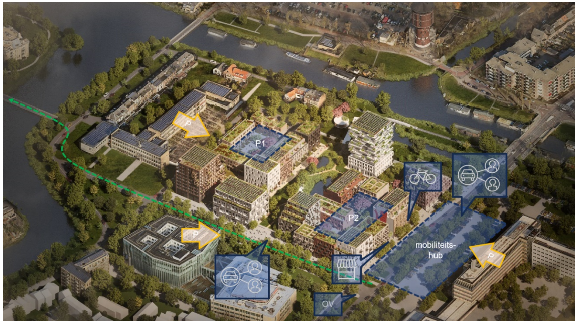
Totale gebiedsontwikkeling Weezenlanden-Noord