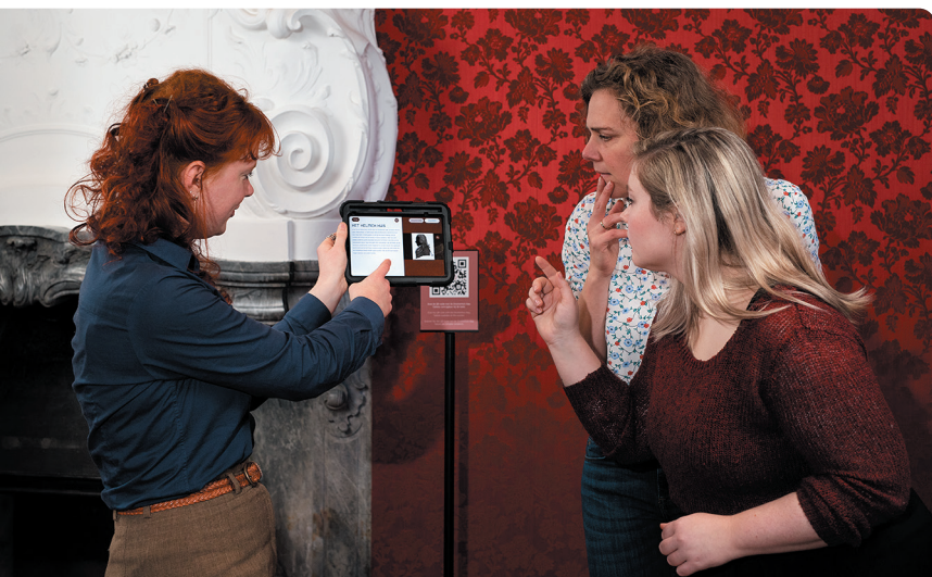
Foto Bezoekers in Het Drostenhuis