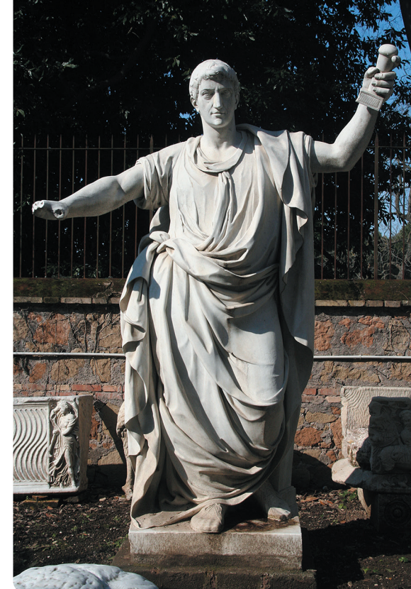
Foto Het beeld van Joan Derk van der Capellen in Rome