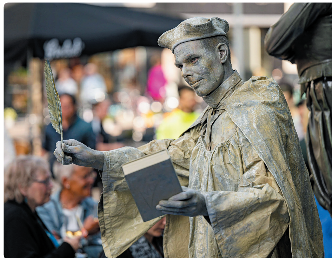
Foto 'Living statue' Thomas a Kempis

neer te zetten. Natuurlijk wel met een andere inhoud. Wie was Joan Derk? En hoe zou hij vandaag de dag tegen de politiek aankijken? Wat zou hij vandaag de dag aan het Volk van Nederland of aan Zwolle schrijven? Samen met het onderwijs, de Van der Capellen Scholengemeenschap, het Deltion College en het