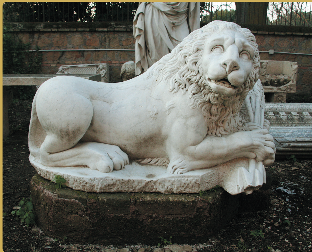
Foto Marmeren leeuw met zeven pijlen

Het monument was bestemd om als een kolossaal mausoleum, bestaande uit vier figuren op een enorm voetstuk, in Zwolle te worden geplaatst. Dit is uiteindelijk nooit gebeurd, omdat de politieke toestand in die tijd er voor zorgde, dat er geen enkele kans was dat het monument in de Republiek geplaatst kon worden.