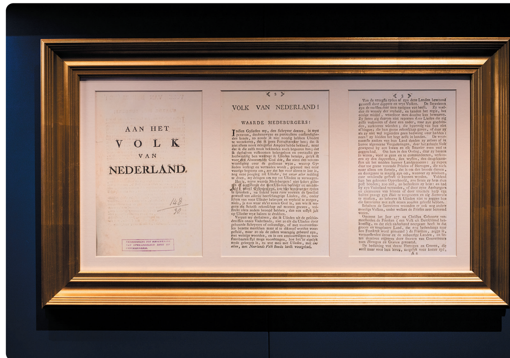
Foto Pamflet 'Aan het volk van Nederland'