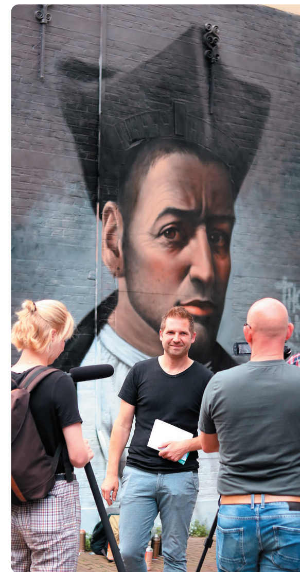
Foto Muurschildering Thomas a Kempis

Bijdragen aan de dialoog tussen politiek en de stad in samenwerking met Pro Demos, Overijssel doet mee! En Studio Divers Bestuur.