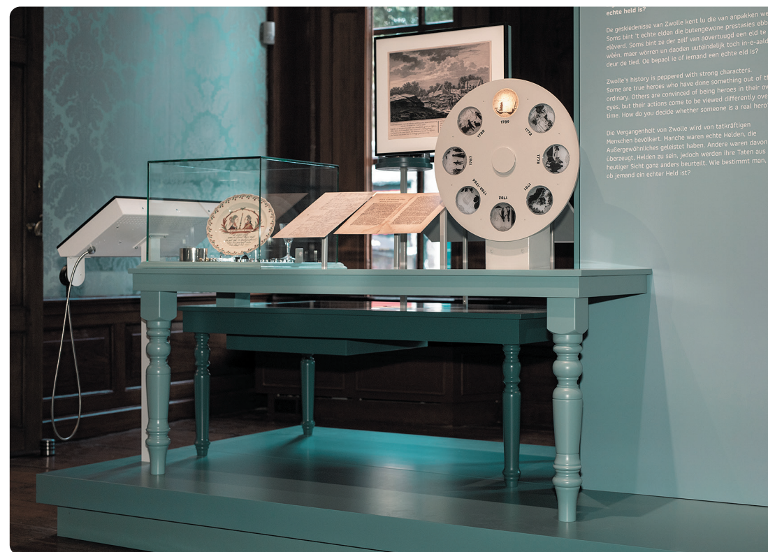
Foto Blauwe kamer Drostenhuis

Stichting Allemaal Zwolle geeft als projectorganisatie vorm aan de publieksactiviteiten van ANNO. Het team bestaat uit veertien medewerkers en ongeveer dertig vrijwilligers. Voor de uitvoer van dit project zal de programmeur een hoofdrol vervullen voor