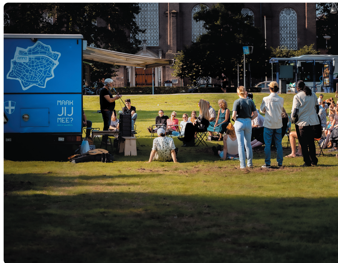
Foto Verhalen vertellen tijdens Sprekend Zwolle

Tot slot heeft dit project actualiteitswaarde: de democratische waarden staan wereldwijd onder druk. Verkiezingsuitslagen worden in twijfel getrokken, er worden complotten geformuleerd over de intenties van politieke leiders en mensen leven in 'bubbels' waardoor hun blik op de wereld vernauwt. Dit project wil het gesprek over het ontstaan van en de waarde van democratie met de stad Zwolle voeren om wantrouwen en polarisatie tegen te gaan.