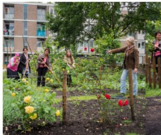
“Wie onderhoudt dit?”