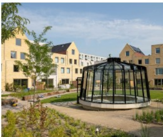
“Dit zou fantastisch zijn!”

Er zijn weinig plekken waar kinderen kunnen spelen. Ze zoeken nu hun eigen plekken, bijvoorbeeld door tegen een muur te voetballen. Dit zorgt voor overlast. Dit project de Kop van Oost biedt de kans om een buurt te maken waar ook kinderen een eigen plek hebben.