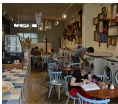
"Geen behoefte aan gedeelde ruimtes"