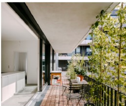
"Graag een dieper balkon!"

Over welke woningen er moeten komen is niet iedereen het eens. Een deel van de bewoners van de portiekflat aan de Anthonie Heinsiusstraat willen in de toekomst graag een huis met een tuin, waar kinderen makkelijker op straat kunnen spelen. Het andere deel vindt het wonen in een portiekflat prima. Hetzelfde geldt voor de bewoners van de Caspar Fagelstraat. Ook over het bouwen van een woontoren is niet iedereen het eens. Vooral de eigenaren van de koopwoningen aan de Caspar Fagelstraat zijn huiverig. De bewoners van de Kop van Oost vinden een woontoren interessant. Ze vragen zich wel af of mensen dan niet te dicht op elkaar wonen en of er voldoende zon is.