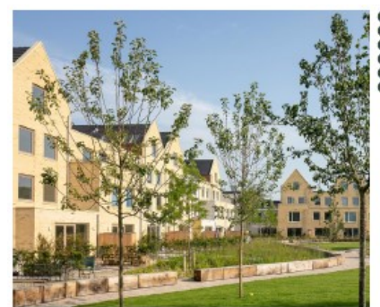
"Een eigen tuin zou mooi zijn"