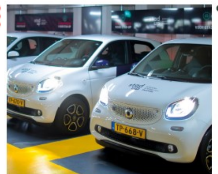
"Heb geen auto, los liever fietsparkeren op"