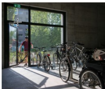
"Op begane grond toegankelijk maken!"