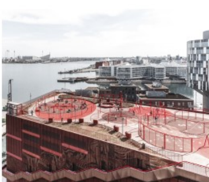
"Veilig naar huis kunnen komen!"

Omwonenden vinden dat er te veel verkeer is. Zij willen daarom een goede oplossing voor het parkeren als er meer woningen komen. Ze vinden het een goed idee om een parkeergarage te maken die direct aansluit op de Meppelerstraatweg. Hierdoor komen er minder auto's in de Caspar Fagelstraat. Wat betreft deelauto's zijn bewoners geïnteresseerd maar dan moeten deze wel betaalbaar zijn.